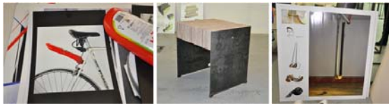
Eine Auswahl der eingereichten ReDesign-Produkte

Die grenzüberschreitende Projektpartnerschaft - unter der Leitung der Arge Reparatur- und Servicezentren GmbH – hat das Ziel ein Umdenken von KonsumentInnen im Hinblick auf Nachhaltigkeit durch bewusste Auswahl von ReUse-Produkten zu bewirken. Durch ein Netzwerk mit erfolgreichen DesignerInnen und KünstlerInnen soll die Aufmerksamkeit auf die Attraktivität dieser Produkte gerichtet werden. Im Rahmen des Projektes soll die Materialbeschaffung verbessert werden und neue Designprodukte entstehen. Sozialwirtschaftliche Betriebe in Wien und Bratislava werden als Pilotbetriebe mit der Umsetzung des Projektknow-hows betraut. Sie dienen damit als Good Practice Beispiel bei der Herstellung von ReUse-Designprodukten als neues Beschäftigungsfeld für die Zielgruppe.