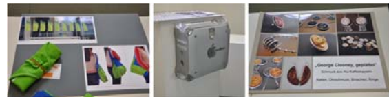
Eine Auswahl der nominierten ReDesign-Produkte

Die Jury nominierte schließlich insgesamt zwölf Ideen für die Preisverleihung, die am 16. September 2010 im Designforum im Museumsquartier stattfand. Erstmals wurde der Re:design[net]WORK Award für einen bisher nicht verwirklichten Entwurf unter Verwendung von Recyclingmaterialien vergeben.