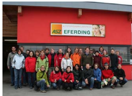
Gruppenfoto vor dem ASZ Eferding

Bei jeder unserer Exkursionen ist zumindest ein kultureller Programmpunkt Pflicht. Im heurigen Jahr wanderten wir entlang der Zeller Ache zur Erlachmühle, einer Holzofenbäckerei, wo wir eine ausführliche Führung durch die alte Bäckerei und Einblicke in die Kunst des Backens erhielten. Nach einer Brotverkostung und einer herzhaften Jause bestritten wir in tiefdunkler Nacht mit Laternen als Wegbeleuchtung den Weg zurück nach Mondsee.