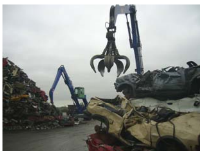
Müller-Guttenbrunn GmbH in Amstetten

In Amstetten erwarteten unsere 32-köpfige Gruppe riesige Greifarme, die Altautos und sonstigen sperrigen Metallschrott wie Spielzeug in den Shredder warfen. Bei der Müller-Guttenbrunn GmbH konnten wir außerdem Smasher und letztlich auch die Anlage der Metran Rohstoffaufbereitung von Nicht-Eisenmetallen besichtigen. Letzter Programmpunkt des ersten Tages war die Altkühlergeräteaufbereitung des UFH in Kematen. Müde, aber mit vielen neuen Eindrücken versorgt, übernachteten wir in einem urigen Schloss in Ulmerfeld.