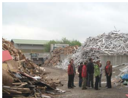
Reststofftechnik GmbH in Henndorf

Tag 2 startete mit der Besichtigung einer Deponie in St. Valentin (OÖ), welche von der NUA Abfallwirtschaft GmbH betrieben wird. Neben Alt-ablagerungen von Hausmüll, gefährlichen Abfällen, Bauschutt sowie Industrie- und Gewerbeabfällen, konnten Ablagerungen von Rückständen aus der thermischen Verwertung und von sonstigen mineralischen Abfällen besichtigt werden. Weiter ging es nach Siggerwiesen (Sbg.), wo uns die Salzburger Abfallbeseitigungs GmbH mit einer Sortieranlage für Kunststoff- und Verpackungsmaterialien, einer mechanisch-biologischen Anlage, einer Grünabfallkompostierung, einer Bioabfallbehandlungs- und Biogasanlage, einer Sonderabfallbehandlung, und einer Deponie mit begehbarer Sickerwasserstollen erwartete. Trotz großem Interesse an den Anlagen mussten wir uns schließlich losreißen, denn auch der letzte Programmpunkt des Tages versprach Beeindruckendes. Die Reststofftechnik GmbH in Henndorf am Wallersee faszinierte mit innovativen Lösungsideen für die stoffliche Verwertung diverser Abfallarten, wie PVC-Rohre, Fenster- rahmen aus unterschiedlichen Materialien etc.